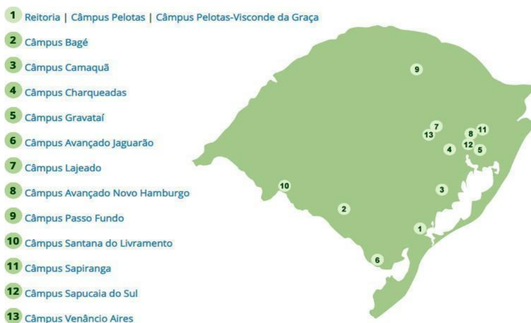
Figura 1 - Distribuição das unidades do IFSul pelo estado

Segundo a Plataforma Nilo Peçanha (PNP), que reúne dados da Rede Federal de Educação Profissional, Científica e Tecnológica (Rede Federal) para fins de cálculos de indicadores, o IFSul atende um total de 24.369 discentes (ano base 2018), matriculados em cursos nas modalidades presencial e a distância. Também exerce o papel de instituição acreditadora e certificadora de competências profissionais.