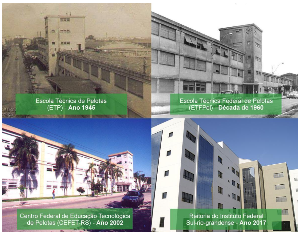
Figura 3 – Prédios da Instituição ao longo do tempo

O Instituto Profissional Técnico funcionou por uma década, sendo extinto em 25 de maio de 1940, e seu prédio demolido para a construção da Escola Técnica de Pelotas. Em 1942, por meio do Decreto-lei nº 4.127, de 25 de fevereiro, subscrito pelo Presidente Getúlio Vargas e pelo Ministro da Educação Gustavo Capanema, foi criada a Escola Técnica de Pelotas (ETP), a primeira e única Instituição do gênero no estado do Rio Grande do Sul. Inaugurada em 11 de outubro de 1943, com a presença do Presidente Getúlio Vargas, começou suas atividades letivas em 1945, com cursos de curta duração (ciclos).