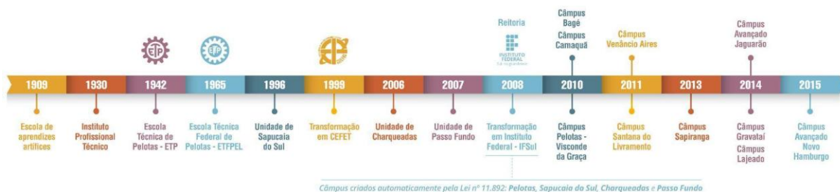
Figura 2 – Linha do tempo de evolução da Instituição

As aulas tiveram início em 1930, quando o município assumiu a Escola de Artes e Ofícios e instituiu a Escola Técnico Profissional que, posteriormente, passou a denominar-se Instituto Profissional Técnico e cujos cursos compreendiam grupos de ofícios divididos em seções: Madeira, Metal, Artes Construtivas e Decorativas, Trabalho de Couro e Eletro-Chímica.